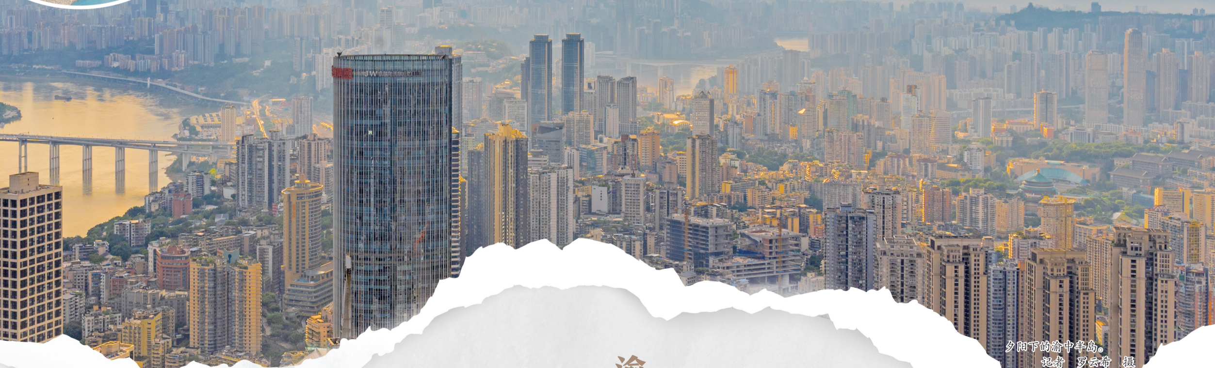
夕阳下的渝中半岛。