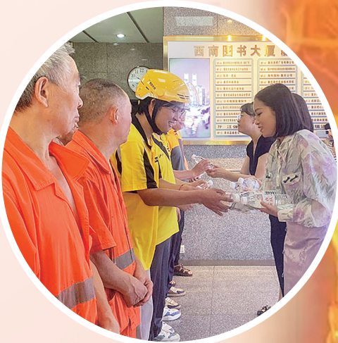
爱心企业为户外劳动者送上矿泉水。

为回馈社会各界的关心和支持,美团外卖(隆鑫花园)站点相关负责人表示,他们的配送员都加入了服务辖区的网格,在保质保量做好配送服务的同时,大家也将关注身边事、辖区事,遇到扰乱市场秩序的行为和各种安全隐患问题积极上报,用实际行动为渝中城市治理出份力。