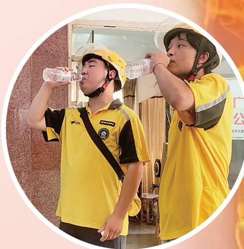
外卖小哥在“夏日清凉驿站”休憩。