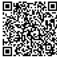
扫码关注重庆渝中APP图文报道

改造，补足配套设施短板，不断提升市民的获得感和幸福感。 扫码关注重庆渝中APP图文报道