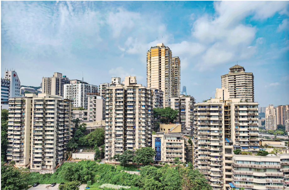
新都巷片区老旧小区改造提升项目本体完工,老旧小区穿上“新衣”。