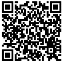
扫码关注重庆渝中APP图文报道

为进一步提高辖区供电可靠性,全力保障客户“零感知”用电,该公司迎难而上,大胆实践,小心求证,克服配电站房设备作业空间有限、结构复杂、作业难度大的实际困难,集中力量专攻狭窄空间配网低压带电作业技术,推动公司带电作业能力不断提升。