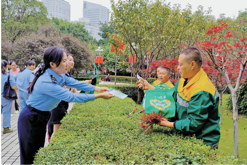
区市场监管局工作人员为环卫工人发放余量食物礼包和食品安全知识宣传册。

“礼包里面是一些小吃,自己回家简单加工一下就能食用了。工作辛苦,一定要记得按时吃饭,更要珍惜食物、节约粮食