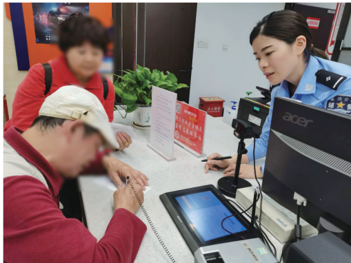
渝中区出入境办证大厅通过“绿色通道”为聋哑老人服务。

今年以来,区公安分局出入境管理支队持续深化“放管服”改革,不断优化办事流程,提升办事效率,整体满意度明