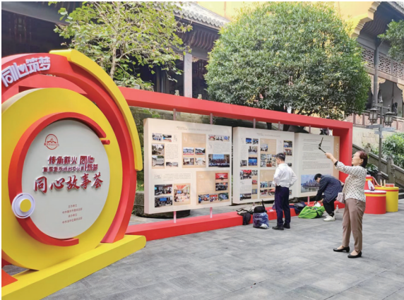
市民、游客观看统战文化宣传展板。