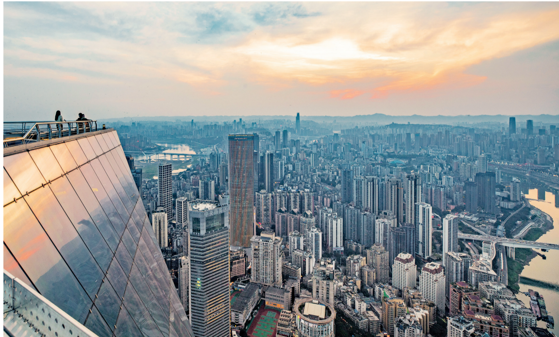
渝中半岛高楼林立。