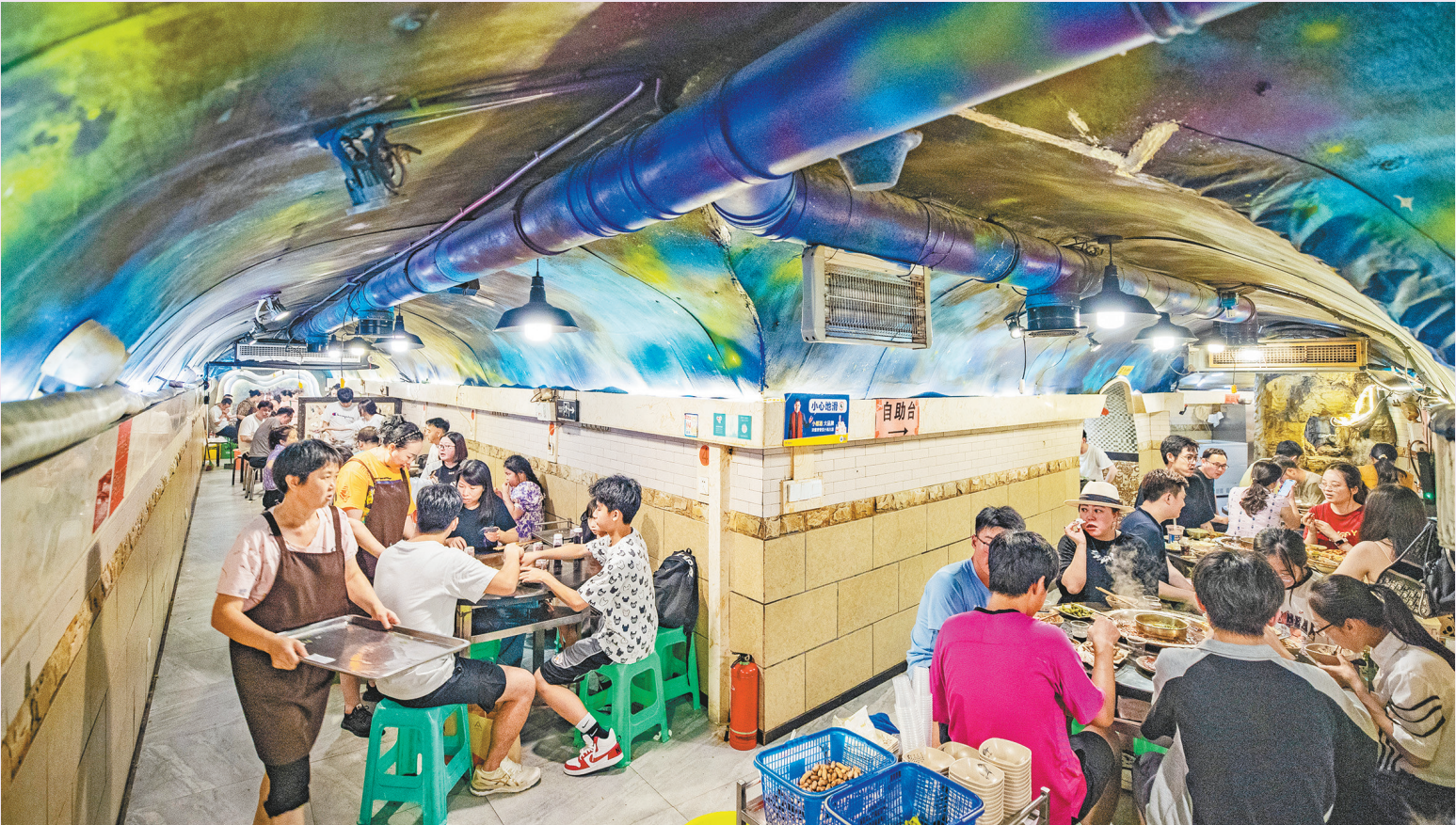
防空洞里的火锅店座无虚席。