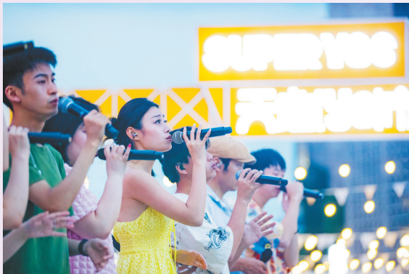
“雾嘟人声乐团”音乐会在重庆天地表演艺术节上演。