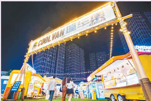
龙湖重庆时代天街“蓬车集”夜市。