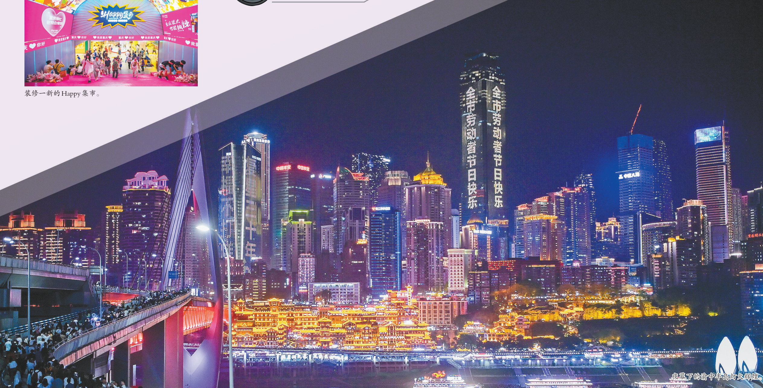
夜幕下的渝中半岛灯火辉煌。