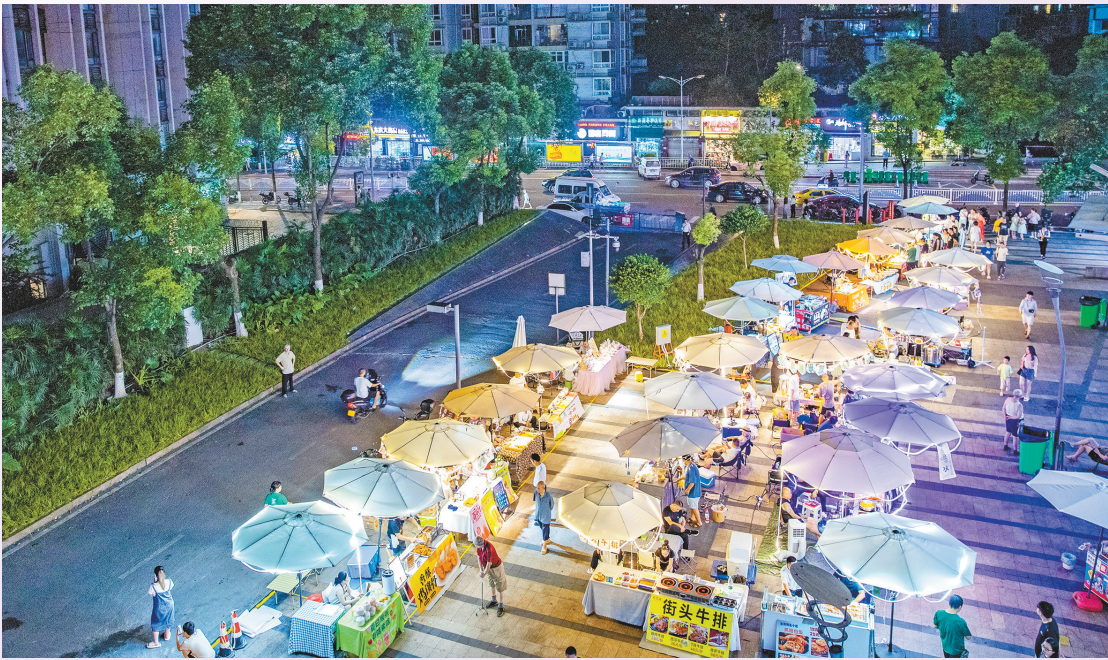
夜幕降临,夜蹲蹲集市热闹开市。