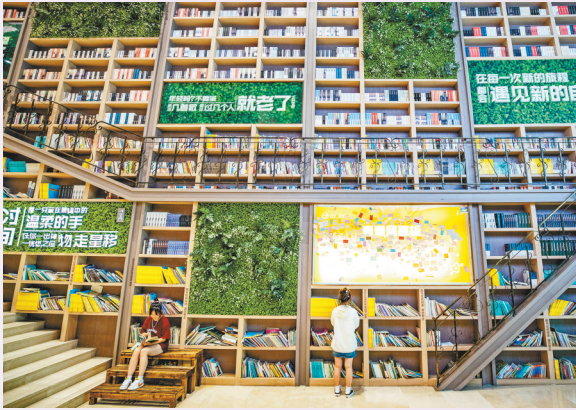
市民、游客徜徉书海或打卡留念。