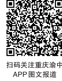
扫码关注重庆渝中APP图文报道

精神状态和昂扬的斗志,坚决打赢疫情歼灭战。 赵世庆表示,渝中将继续把疫情防控作为当前头等大事和首要任务抓紧抓实抓细,坚持方略、坚定信心、坚守职责,精准高效落实各项防控措施,努力做到管理更到位、措施更有效、群众更满意,坚决打好打赢疫情防控这场硬仗,确保各项部署要求落到实处、见到实效,全力守护人民生命安全和身体健康。